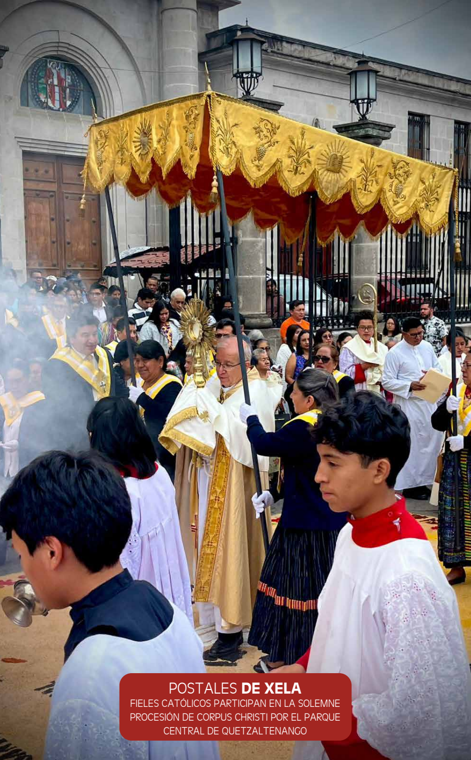
POSTALES DE XELA FIELES CATÓLICOS PARTICIPAN EN LA SOLEMNE PROCESIÓN DE CORPUS CHRISTI POR EL PARQUE CENTRAL DE QUETZALTENANGO